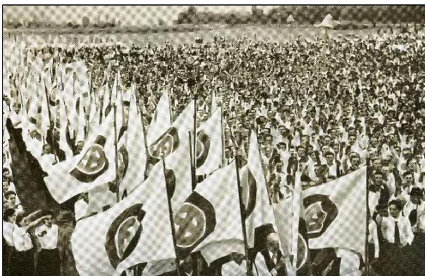
Abb.2: Großkundgebung des Volksbunds im August 1940 in Hidas (Postkarte des VDA)

Obwohl der Volksbund eine Organisation aller Deutschen in Ungarn sein und alle Lebensbereiche von der wirtschaftlichen über die soziale bis zur politischen Tätigkeit umfassen wollte, beschränkten sich die Satzungen auf den Kulturbereich. Das verfolgte Programm des „ethnic revivals“, wozu der Volksbund auch reichsdeutsche Förderung in Anspruch nahm, bedeutete, dass sich die im Volksbund organisierten Deutschen nicht nur als Teil der ungarischen Staatsnation, sondern auch der deutschen „Volksgemeinschaft“ als zugehörig betrachteten. Mit der Zeit kam es zu einer klaren Verschiebung zugunsten letzterer, in dessen Folge die Loyalität gegenüber Ungarn immer schwächer wurde. Die strenge Organisationsstruktur des Volksbundes mit seinen spektakulären Massenversammlungen und seiner großen Propagandatätigkeit stellte die ungarische Regierung vor eine neue Herausforderung. Das Ergebnis war eine Radikalisierungsspirale auf beiden Seiten.