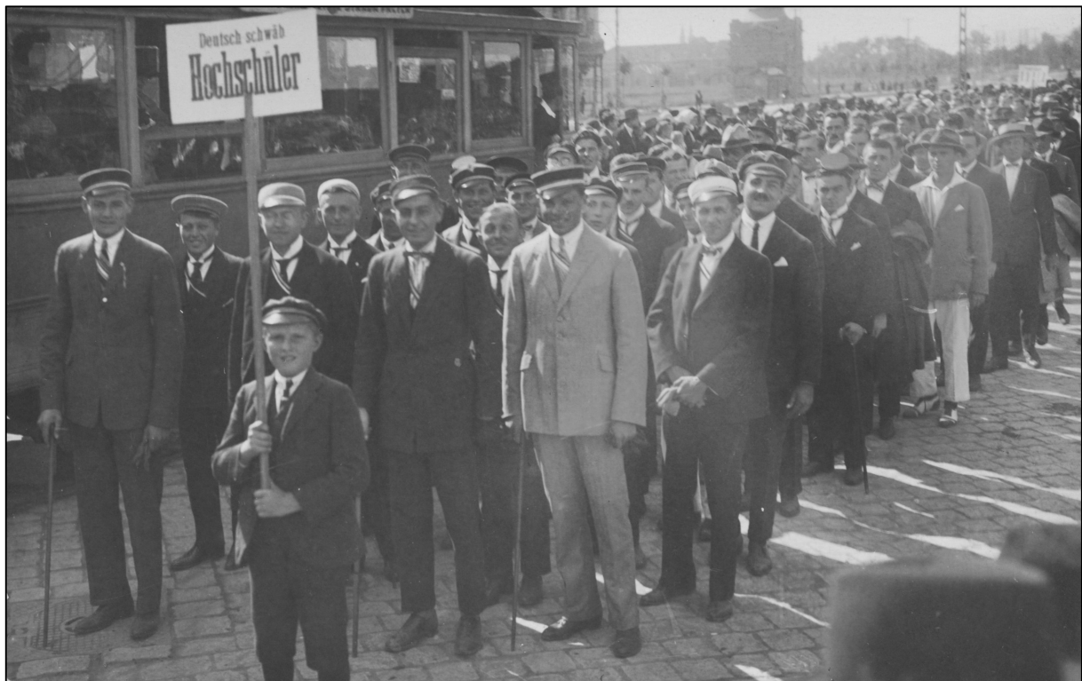
Abb. 1: Gruppe der Hochschüler beim Schwabenfestzug in Temeswar. Postkarte, herausgegeben vom Kulturamt des Verbands der Deutschen aus Großrumänien

Den ersten Anstoß zur Organisation einer Einwanderungsfeier gab der Bund Deutscher Hochschüler in Rumänien auf seiner zweiten Jahrestagung 1922. Den Aufruf übernahm der Deutsch-Schwäbische Volksrat, der auf der Sitzung von Februar 1923 den Beschluss zu einer großzügigen Feier fasste und den Schwäbischen Landwirtschaftsverein, den Kulturverband, den Sängerbund und den Deutschen Frauenverein, den Verband der Deutschen in Großrumänien und die deutschen Sportvereine miteinbezog.