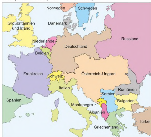
Europa um 1913 (ohne Kleinstaaten)