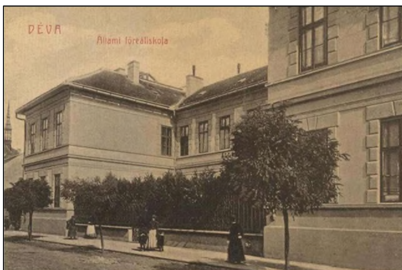
Abb. 1: Die staatliche Oberrealschule in Diemrich vor 1918 Quelle: Sammlungen des Instituts für donauschwäbische Geschichte und Landeskunde

Die Oberrealschule mit Abiturabschluss wurde in Ungarn 1875 zur Zeit der Mittelschulreform etabliert. Ziel dieser Bildungsanstalt war es, die Schüler auf eine Laufbahn in naturwissenschaftlichen und technischen Bereichen vorzubereiten, indem sie vorrangig „Realien“, d. h. moderne Fremdsprachen sowie Mathematik und Naturwissenschaften, unterrichtete. Das dort erworbene Abitur ermöglichte den Zugang zu naturwissenschaftlichen, bergbaulichen und forstwirtschaftlichen, später auch landwirtschaftlichen Fachhochschulen und Universitäten. Realschulen waren in der Regel staatliche Einrichtungen, und wo sie an der Peripherie des historischen Ungarn entstanden sind, waren sie eine natürliche Erweiterung der ungarischen nationalen Hegemonie und des damit verbundenen Modernisierungsversprechens. Nach der ungarischen Volkszählung von 1910 wies Diemrich, das Zentrum des überwiegend von Rumänen bewohnten Komitats Hunyad, eine leichte ungarische Mehrheit und eine starke rumänische Minderheit auf. Somit war die Oberrealschule berufen, auch die ungarische Staatsidee zu fördern.