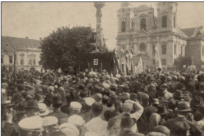
Abb. 2: Festmesse auf dem Domplatz anlässlich des Schwabenfestzuges in Temeswar. Postkarte, herausgegeben vom Kulturamt des Verbands der Deutschen aus Großrumänien