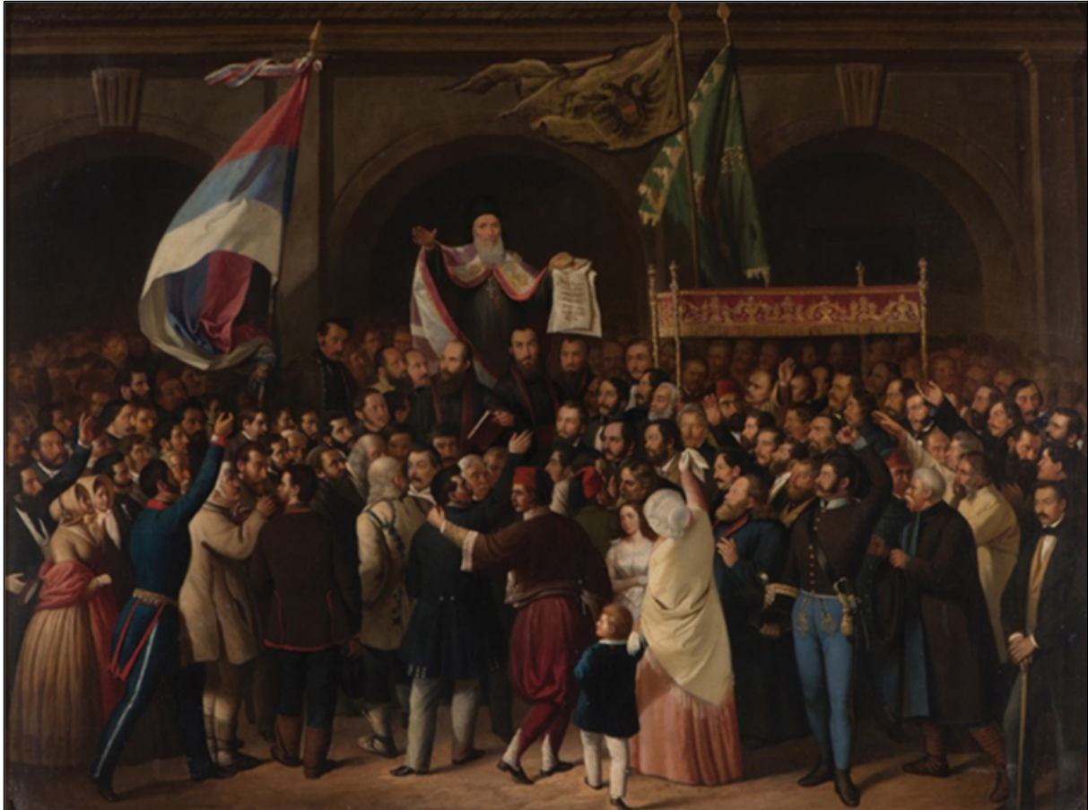
Abb. 3: Große Nationalversammlung der Serben, Bunjewatzen und anderer Slawen in Banat, Batschka und Baranja, Anastas Bocarić, 1922/1923