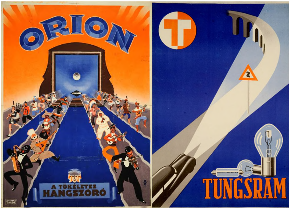
Abb. 1: Werbeplakate für die 1924 gegründete Orion Aktiengesellschaft und die Tungsram Werke, die ihr Profil nach 1921 weiter ausbauten