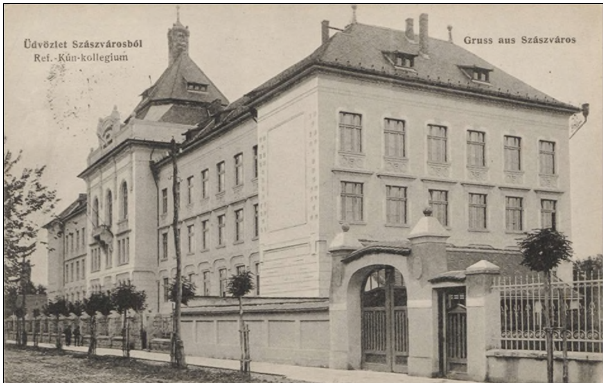
Abb. 2: Das Reformierte Kun-Kolleg in Broos