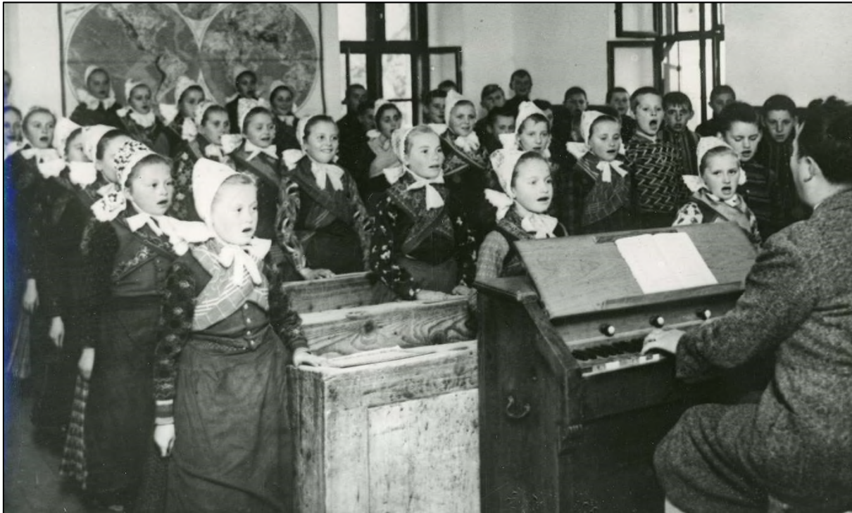
Abb. 1: Kinder der Volksschule der Gemeinde Mözs im Komitat Tolna 1939

umzuwandeln. Da Ungarn seit Herbst immer mehr zur alten ethnopolitischen Praxis zurückkehrte, verschlechterte sich jedoch die Lage wieder. Erst infolge des im Friedensvertrag implementierten Minderheitenschutzvertrages und der wachsenden Unzufriedenheit unter den Minderheiten sah sich die ungarische Regierung gezwungen, die Schulfrage zu lösen. Sie führte ab 1923 drei Typen von Minderheitenschulen ein: den Typ A – als eigentliche Minderheitenschule mit Unterricht in der Muttersprache und Ungarisch als Pflichtfach; den Typ C – als Pendant vom Typ A mit einem ungarischsprachigen Unterricht und der Minderheitensprache als Pflichtfach; sowie den Typ B als eine Mischform – mit einzelnen Lehrfächern in der Sprache der Minderheit und auf Ungarisch.