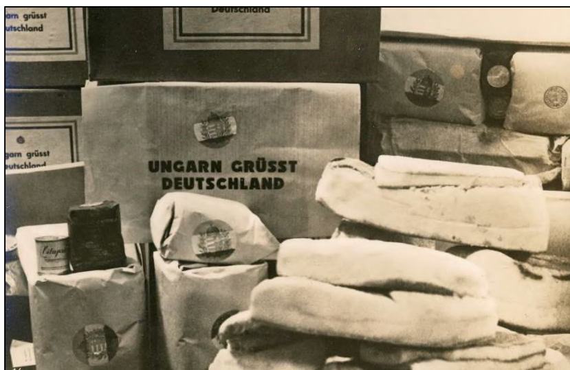
Abb. 3: Hilfspakete aus Ungarn für Familien im Deutschen Reich, Januar 1940

Die Auslieferung der deutschen Minderheit durch die ungarische Regierung an das Deutsche Reich hatte aber auch schwerwiegende Folgen für den Kriegsverlauf. Durch die jetzt auch in Ungarn gegründeten deutschen Wirtschaftsgenossenschaften konnte das Reich die wirtschaftliche Leistung der deutschen Volksgruppe, die unter der Devise der Mehrproduktion und im Rahmen des Wirtschaftlichen Kriegshilfsdienstes der Heimat organisiert wurde, abschöpfen. In der Batschka, die infolge der Zerschlagung Jugoslawiens 1941 an Ungarn zurückgegliedert wurde, musste Ungarn per Vertrag den gesamten wirtschaftlichen Überschuss an Deutschland (und Italien) abliefern. Der Druck auf die Drosselung des eigenen Verbrauchs im Land wuchs ständig. Von den 40.000 Tonnen Ölsaaten gab Ungarn 1942 rund 25.000 Tonnen an Deutschland ab. Ebenfalls beträchtlich war der Export von Hanf, dessen Anbau bis zu 70 Prozent in der Hand der Batschka-Deutschen lag. Die für die Auslandsdeutschen zuständige Volksdeutsche Mittelstelle bezifferte den Beitrag der ungarndeutschen Wirtschaft im Jahre 1943 bei Weizen auf 19 Prozent, bei Mais auf 24 Prozent, bei Schweinen auf 70 Prozent, bei Rindern auf 73 Prozent und bei Obst auf 68 Prozent der gesamtungarischen Warenausfuhr. Die Ungarndeutschen führten außerdem zweimal so viel Butter (193 Prozent) und Wein (222 Prozent) an das Reich ab wie das restliche Ungarn.