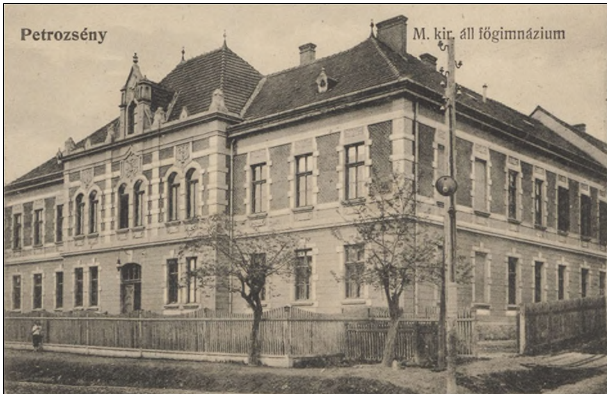
Abb. 3: Das ungarisch-königliche staatliche Obergymnasium in Petroschen

Im letzten Friedensjahr vor dem Ersten Weltkrieg zählte die Schule 183 Schüler, von denen sich 144 als Ungarn, 23 als Rumänen, 14 als Deutsche und jeweils einer als Italiener und Slowake bezeichneten. Die meisten Schüler (173) kamen aus dem Komitat Hunyad. Die Mehrheit der Eltern arbeitete im Bergbau- und Industriesektor (36), im Handels- und Transportwesen (23) oder gab an, private Bergleute (18), Pastoren, Lehrer und Erzieher (13) zu sein. Dank der Verstaatlichung der Schule verbesserte sich die Qualität des Unterrichts, indem der Lehrkörper nun ausschließlich aus diplomierten Lehrern bestand. Gleichzeitig war der Lehrkörper durch eine enorme Fluktuation gekennzeichnet: So gab es im Schuljahr 1917/18 keinen einzigen Lehrer, der von Anfang an an der Schule unterrichtet hatte.