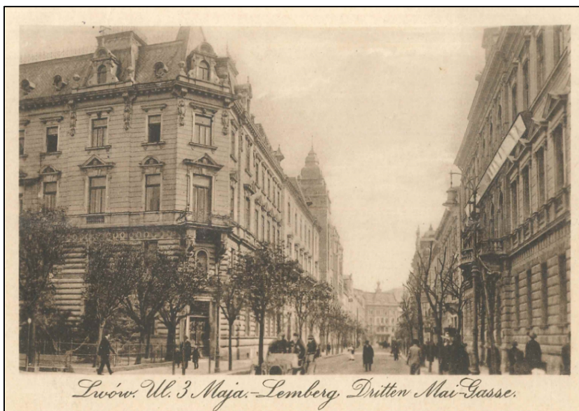
Abb. 1: Lemberg, als Feldpostkarte gelaufen im Jahre 1917

Im 13. Jahrhundert wurde Lemberg zum ersten Mal urkundlich erwähnt und nach Lew, dem Sohn eines Fürsten von Wolhynien, benannt. Seit Mitte des 14. Jahrhunderts und bis 1772 war es eine polnische Stadt, die sich zwischendurch gegen Tataren und Türken wehren musste. Danach kam sie unter österreichische Herrschaft. Im Ersten Weltkrieg wurde Lemberg von den Truppen des russischen Zaren besetzt und 1915 von der k. u. k.-Armee zurückerobert. Georg Trakl, der im Herbst 1914 in einem Feldlazarett arbeitete, erlebte die Schlacht um Lemberg aus nächster Nähe. Er nahm sich einige Monate später das Leben, zurückblieb das Gedicht Grodek , die Denkfigur des Krieges: „[...] Doch stille sammelt im Weidengrund / Rotes Gewölk, darin ein zürnender Gott wohnt, / Das vergoßne Blut sich, mondne Kühle; Alle Straßen münden in schwarze Verwesung (Trakl 1982, 155).“